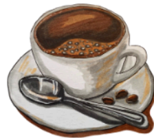
słodka i droga kawa