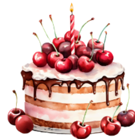
słodki i drogi tort